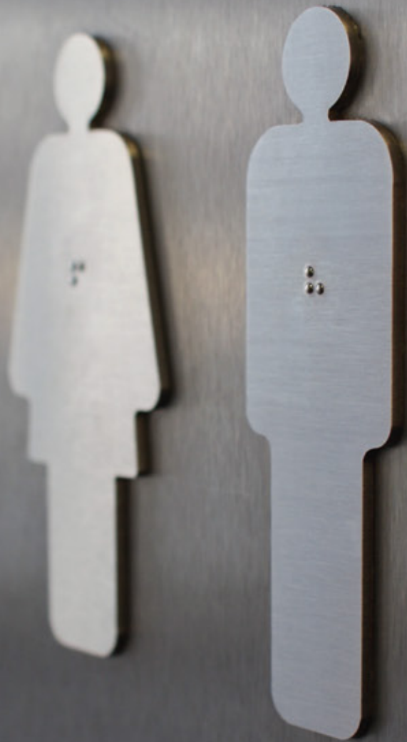
littera LIT 100 SS